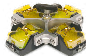
Ротор JS-4.750μ (без микропланшетов и крышек)