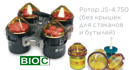
Ротор JS-4.750 (без крышек для стаканов и бутылей)