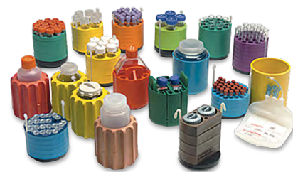
Таблица 3. Модульные дисковые адаптеры (полипропилен).